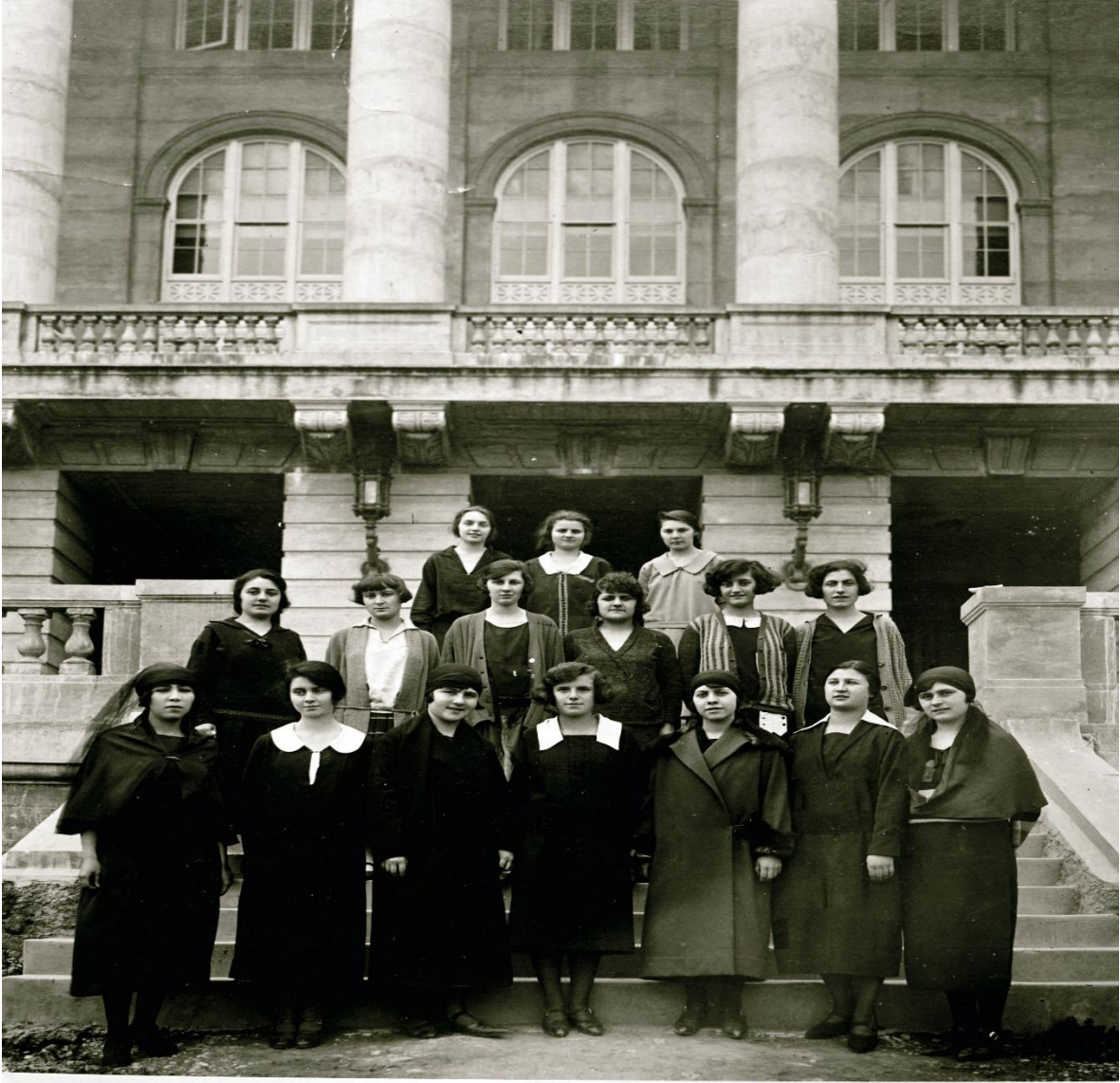
One Student of Each Nationality 1923 - 1924

görmektedir. Kolejin eğitim verdiği ilk yıllarda, çok az sayıda öğrenci derslerini tamamlayıp mezun olurken, zaman içinde mezunların sayısı artmıştır. Buradan mezun olan öğrenciler gerek Osmanlı İmparatorluğu gerekse de Türkiye Cumhuriyeti'nde siyasal, toplumsal, ekonomik ve kültürel hayatın şekillenmesinde önemli rol oynadı. Okul mezunları arasında pek çok tanınmış siyasetçi, yazar, sanatçı, bilim insanı ve sporcular bulunuyor.