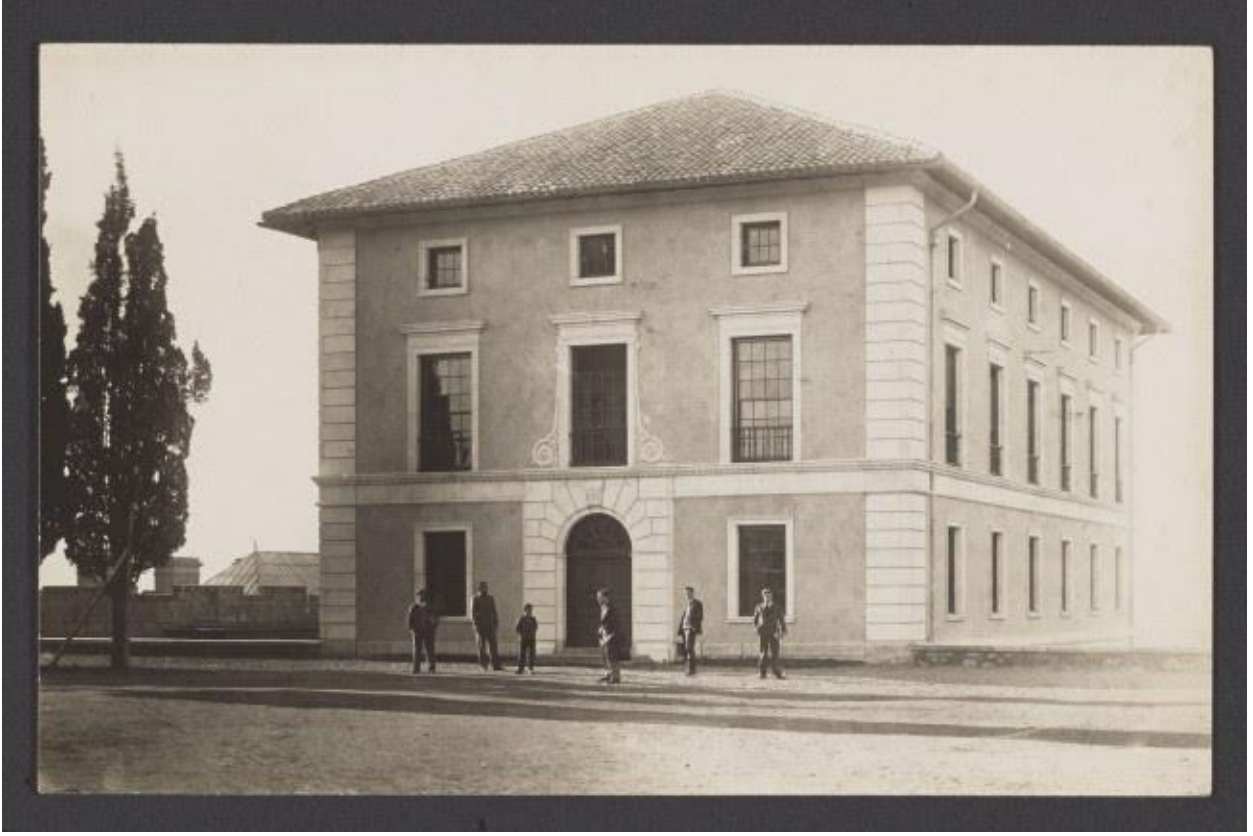
Van Millingen Hall.